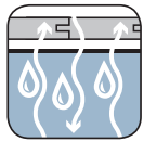
Wasser- und wasserdampfdurchlässig